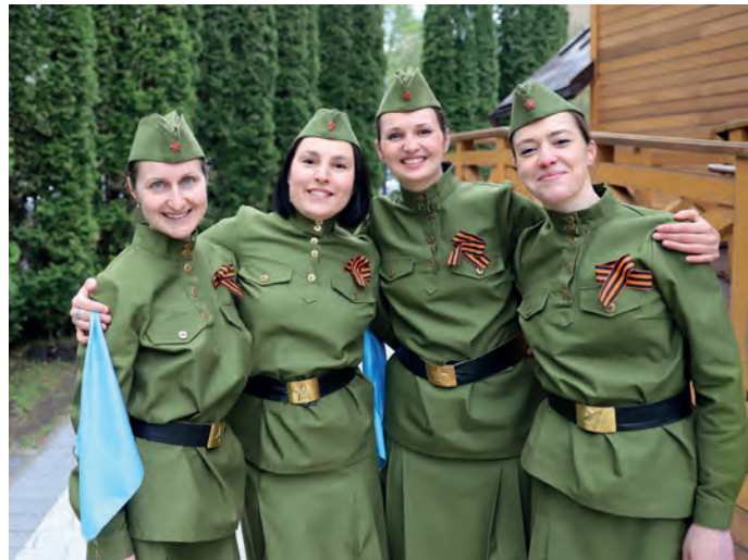
А зори здесь тихие...