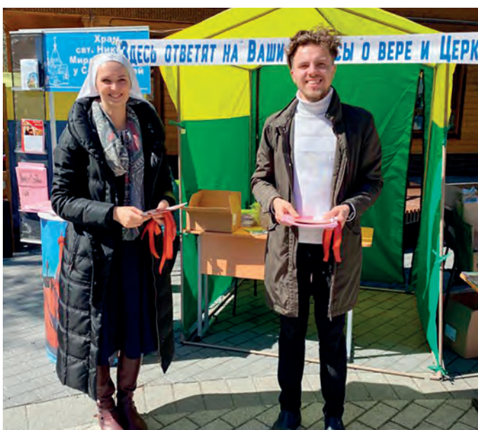
«Давайте говорить о Боге!»