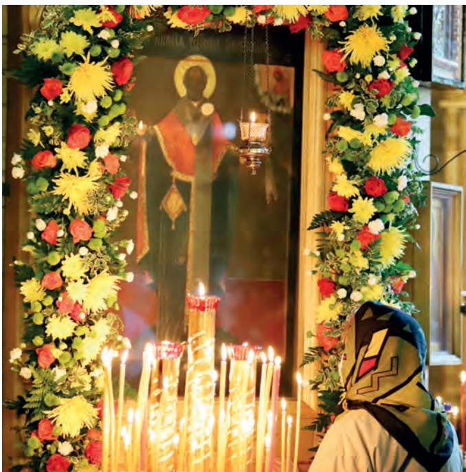
Радуйся, Николае, великий чудотворче!