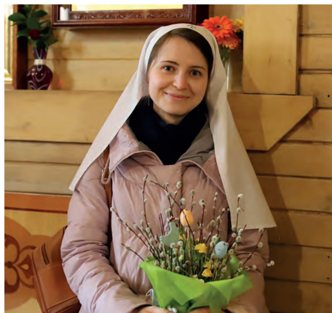
Посидеть в тишине после службы