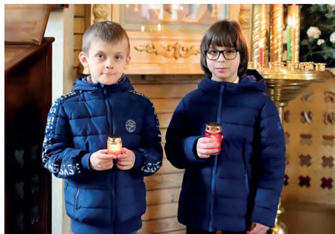
В ожидании чуда