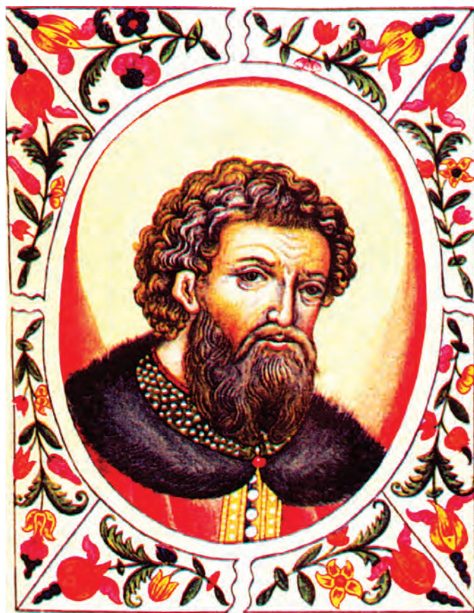
Миниатюра из «Царского титулярника», 1672 год

своим сердцем, любил людей и удивительно сочетал со своим исключительным мужеством трогательное милосердие и участие к обездоленным.