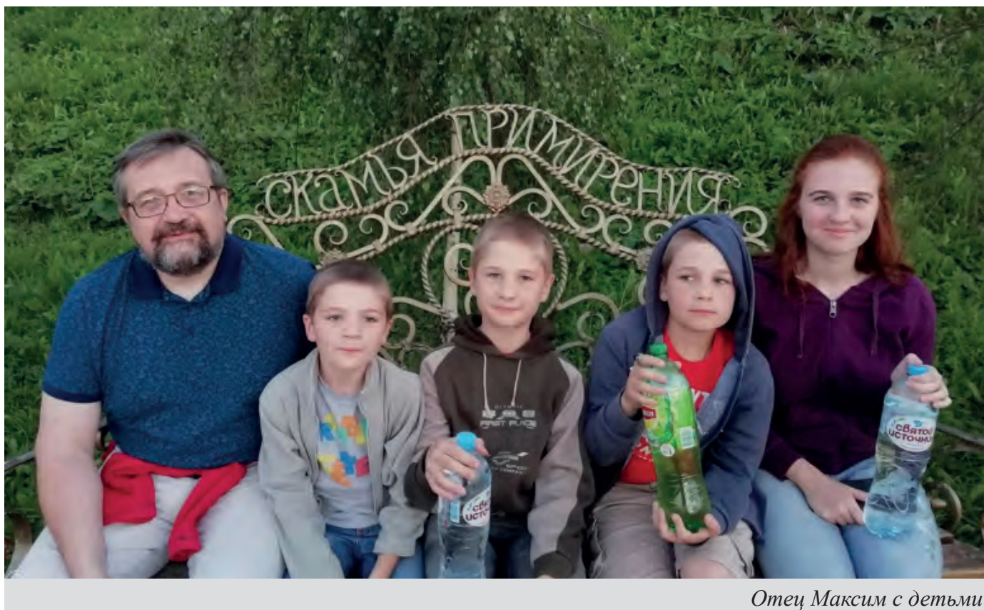
Отец Максим с детьми

собой в этой гармонии, то это оно из важнейших совершенств человеческих, которые могут быть. Кто-то себя недооценивает, кто-то себя переоценивает, а вот понять, где ты, и быть на этом месте – это совершенно великая задача. Я думаю, что Петр Мамонов как человек творческий имел много и планов, и задумок, но в последние годы он нашел эту истину, уехал в деревню с семьей и там духовно возрел. Можно сказать, у него был такой духовный монастырь, и эти плоды Духа всем видны.