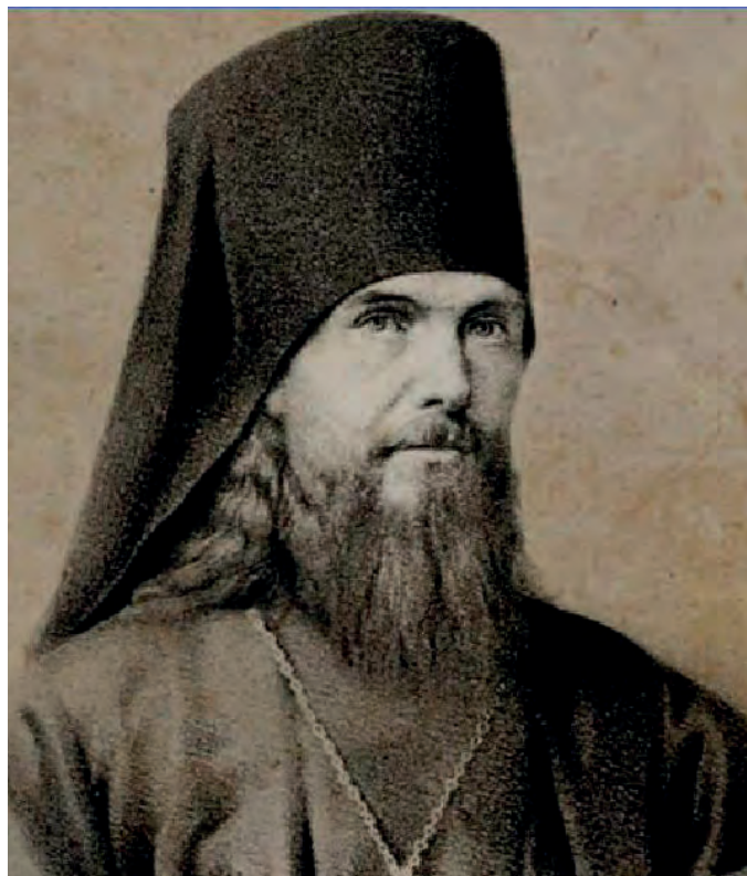
Святитель Феофан Затворник

– Вы недавно защитились и Вашу выпускную работу посвятили святителю Феофану Затворнику. Поделитесь, пожалуйста, Вашими открытиями об этом святом.