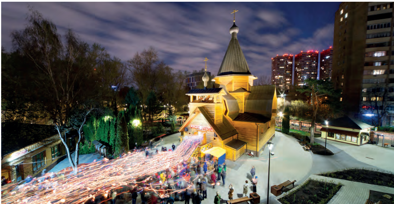
Пасхальный крестный ход 2021 года