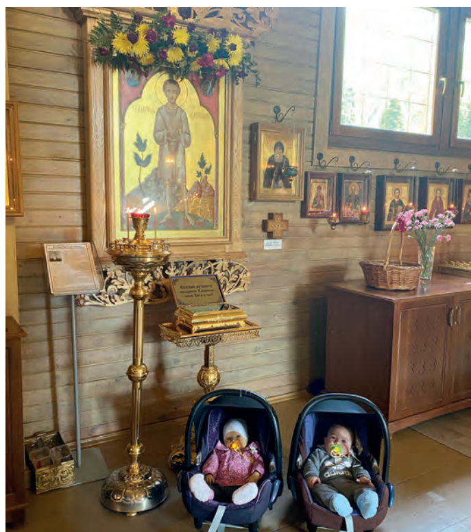
«Молимся младенцу Гавриилу с двойной силой!»